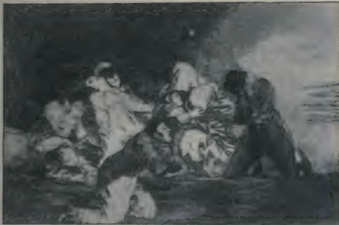
La fusillade, épisode du 2 mai. (Goya : Les désastres de la guerre. )

manœuvrer et défiler par les rues les plus peuplées ses soldats. On les siffle et, des lors, ils s'accoutument à regarder comme des ennemis les partisans de Ferdinand VII.